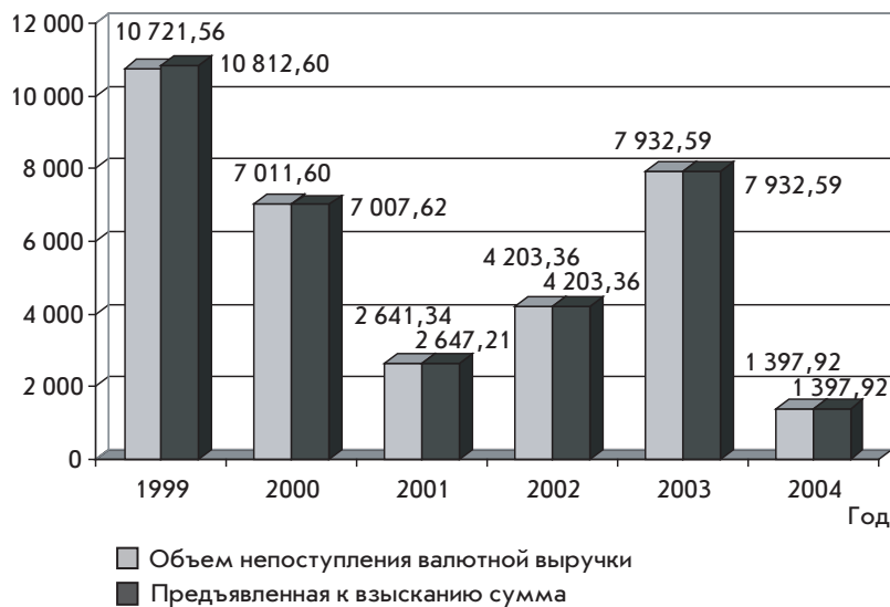
Рис. 2. Выявленный объем непоступления валютной выручки от экспорта товаров и предъявленная к взысканию сумма в 1999–2004 гг., тыс. дол.